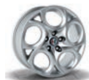
5YN / 5ER