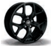
OR4 / 7PD