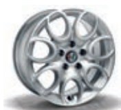
74A / 56J