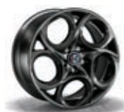
6Y8 / 5EV