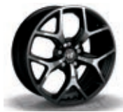
OR5 / 7PN