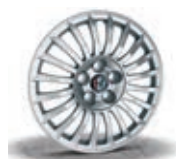
404 / 415