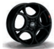
9S5 / 9S1