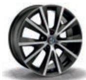
6H6 / 9RZ