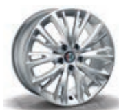
74B / 5ZZ