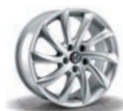
420 / 5EQ