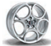
68P / 8CE