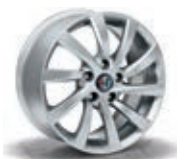
431 / 4AW