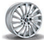
68Q / 9F0