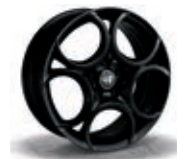
6JB / 9S0

● = di serie - = non disponibile A = alternativa senza sovrapprezzo